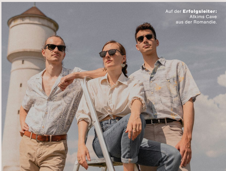
Auf der Erfolgsleiter: Atkims Cave aus der Romandie.